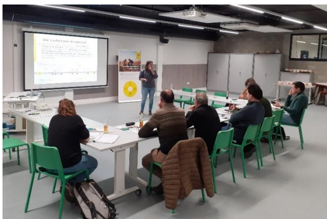
Foto: Workshop Eeklo

Adviseurs van de Begeleidingsdienst voor Betere Bodem- en Waterkwaliteit (B3W) kwamen op zeven locaties in Vlaanderen samen met telers om hen te informeren over beredeneerd bemesten en hoe dit in de praktijk kan worden ingevuld. Tijdens de workshops werden de boekjes 'Eerste hulp bij de basisbemesting' van groenten en aardappelen toegelicht. Deze boekjes bevatten praktische tips, cijfermateriaal en rekenvoorbeelden waarmee je als teler zelf je basisbemesting op een eenvoudige en perceelsspecifieke manier kan berekenen.