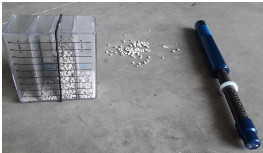
Figuur 1 Fractiemeter en hardheidsmeter

Veel landbouwers gaan er automatisch van uit dat de verkoper van de kunstmeststoffen de juiste kwaliteiten van kunstmest levert, wat op zich niet onlogisch is. Ook bij landbouwer Bert Keppens was dit het geval. De kwaliteit van de kunstmest zal zeker niet verkeerd zitten, maar toch moeten we er rekening houden dat we de dag van vandaag graag alles in zo min mogelijk werkgangen toedienen, waardoor we vaker werken met eigen samengestelde blends van meststoffen. Daar is zeker niets verkeerd aan. Landbouwers zelf kunnen met eenvoudige technieken ook de kwaliteit van de meststoffen controleren. Hiervoor hebben ze een fractiemeter en een hardheidsmeter nodig.