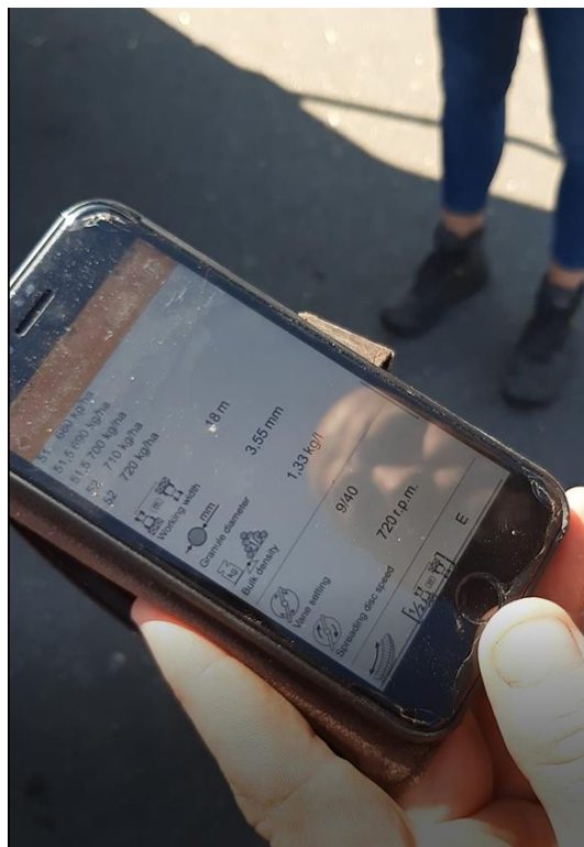
Figuur 3 App kunstmeststrooier

Ook de hoogte van de kunstmeststrooier is van belang. Deze wordt gemeten vanaf het gewas in plaats van vanaf de bodem. De juiste hoogte wordt beschreven in de strooitabel of in de handleiding van de strooier. Bij de kunstmeststrooier van Bert Keppens kan hij alle instellingen die hij moet doen op zijn kunstmeststrooier zien via een app van de fabrikant.